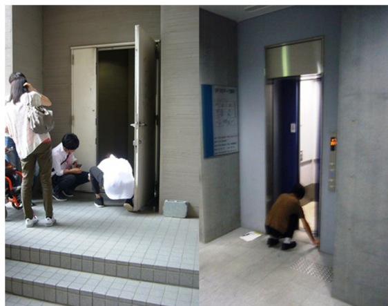
※画像はいずれも(2)-1に関する調査実施時の様子