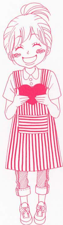
イラスト / 後藤朝美(2006年度生)

バリアフリー推進室は、この実現に向け、授業での情報保障や、学生生活支援、バリアフリー推進のための教育活動、情報収集・発信などをおこないます。ボランティアセンター内に位置し、バリアフリーコーディネーターが常駐しています。