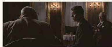
協力：京都外国語大学

本映画祭の過去入選作品である『BERLIN TROIKA』を題材に字幕翻訳ワークショップを行います。映画の字幕翻訳には、限られた文字数で正確に翻訳する技術が必要になります。この機会に、皆さんもそうした字幕翻訳の一端に触れてみませんか？