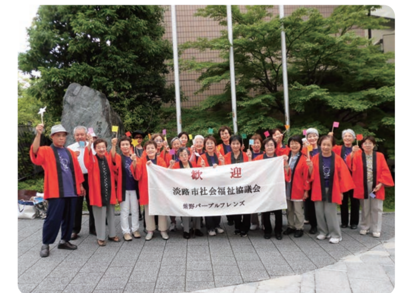
大学で淡路の社協と交流