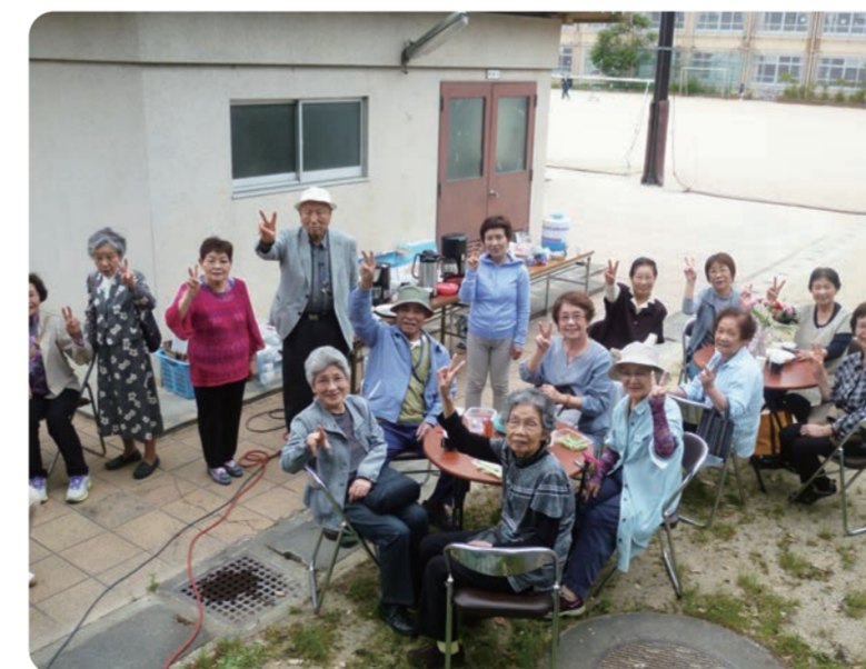
紫野小学校でのカフェ