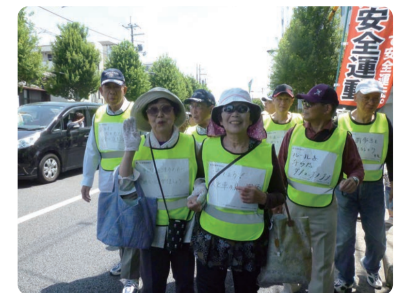
交通安全パレード