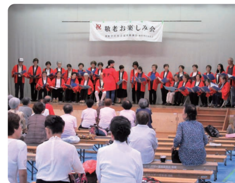
敬老会での歌披露