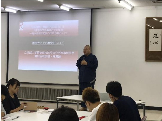
▲僧侶からの貴重なお話を直に聞き、文化遺産の価値と重要性を学んだ。