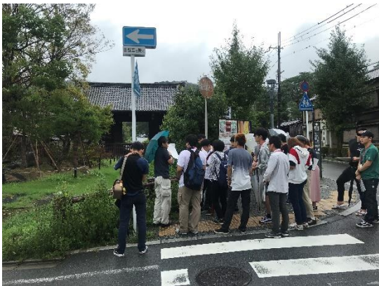
▲フィールドワーク