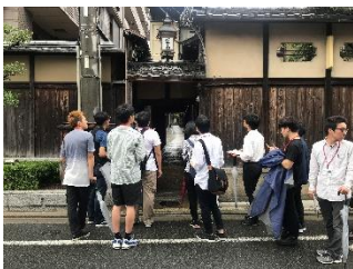
フィールドワーク

世界文化遺産である清水寺は、年間400万人を超える参拝者があり、日本を代表する寺院です。本プログラムでは、この貴重な文化遺産を守るために取り組まれている活動や設備について、座学とフィールドワークで学びます。清水寺では文化財等を維持管理し、火災等の災害から守ることを主な目的として「清水寺警備団」が結成され、現在に至っております。 また、地震による大火から守るために、京都市が平成18年度から国宝や重要文化財が集積する東山区清水・弥栄地域において、地域力を最大限に発揮して防災力を強化する「文化財と地域を守る防災水利整備事業」を展開しています。フィールドワークでは、清水寺の文化財の価値について僧侶から説明を受け、実際に見学を行い、境内と周辺地域の災害リスクに関するグループ調査を行います。最後に「災害図上訓練D I G」を行い、文化遺産を核とした地域の災害脆弱性と対策について幅広い観点から考察し、グループごとに発表します。