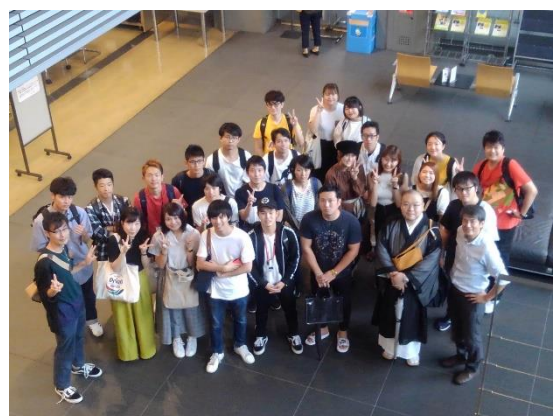
▲最終日の意見交換会後の集合写真