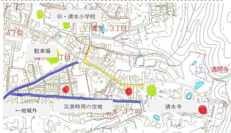
▲ 提案された避難ルート