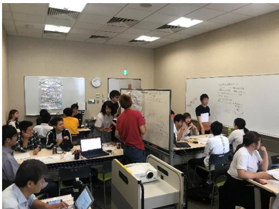
▲災害図上訓練時により、地域の災害危険性を明らかにした。