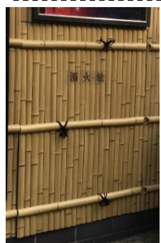
▲ 景観に配慮された消火栓

これらの事から、幅広い視点から現状を把握し、災害対策のあり方についての具体的な検討を行うことができる能力が身に付いたと考えられ、本講義の目的を果たしたものと思われまます。