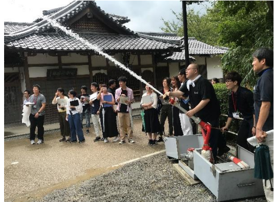
▲消防設備見学・実技体験