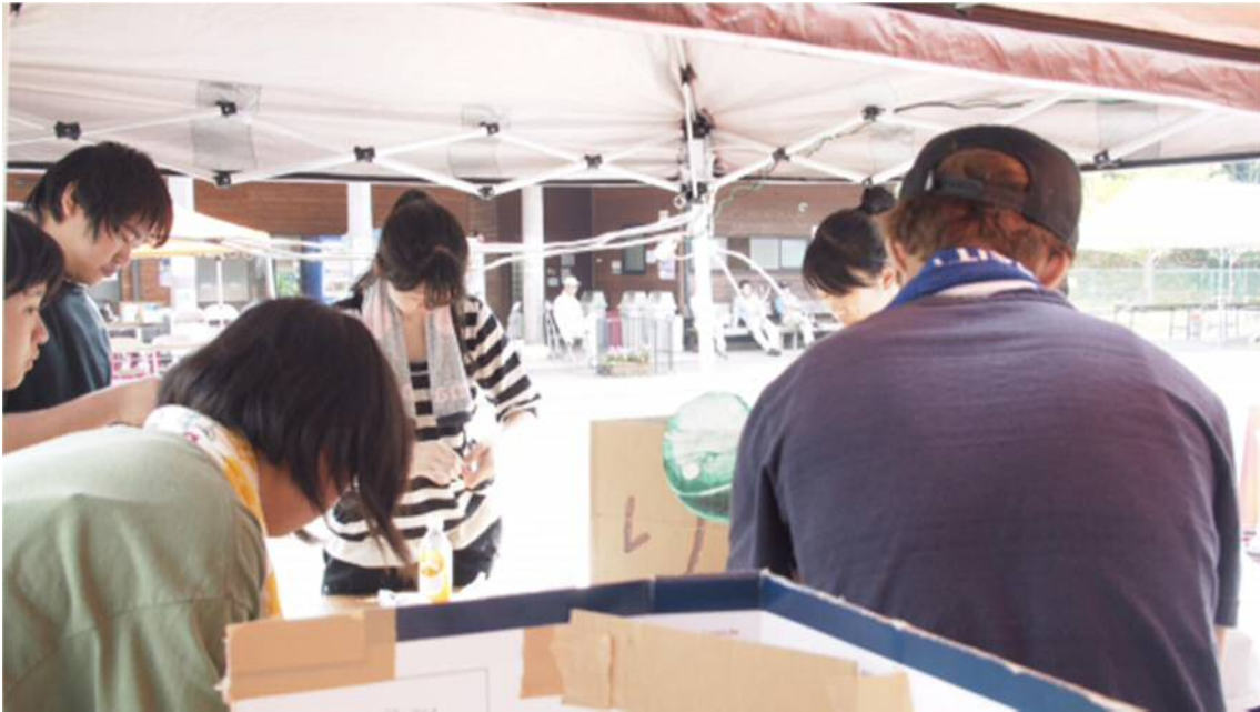
大繁盛なヨーヨー。