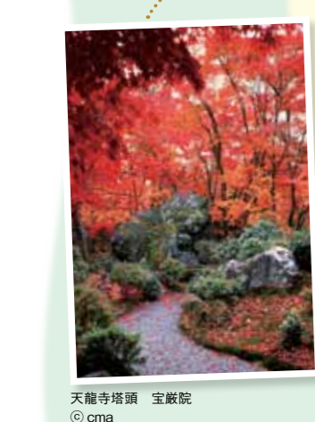
天龍寺塔頭 宝厳院

その他の文化施設 京都国際マンガミュージアム、京都市青少年科学センター、京都伝統産業ふれあい館、京都万華鏡ミュージアム姉小路館、大西清右衛門美術館、京都絞り工芸館、京都府立陶板名画の庭、高台寺掌美術館、島津製作所創業記念資料館、西陣くらしの美術館富田屋、藤森神社宝物殿、宮井ふろしき・袱紗ギャラリー、霊山歴史館(幕末維新ミュージアム) ※施設により優待内容が異なりますので、webサイトなどをご確認ください。 ※各施設で優待を受けるには「携帯会員証」及び「学生証」が必要です。