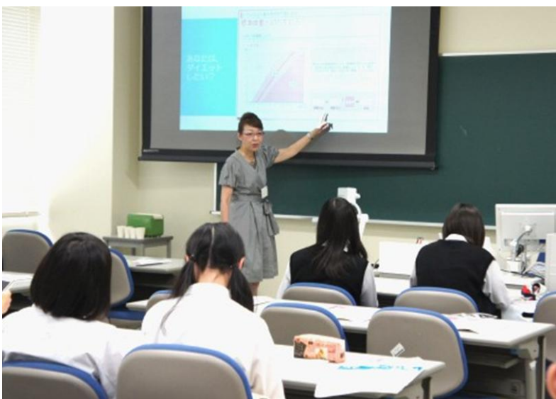
京都聖母女学院短期大学の講座タイトルは「ダイエットの勘違いを探してみよう!」。栄養学から提案する、食べ方について学ぶ講座でした。