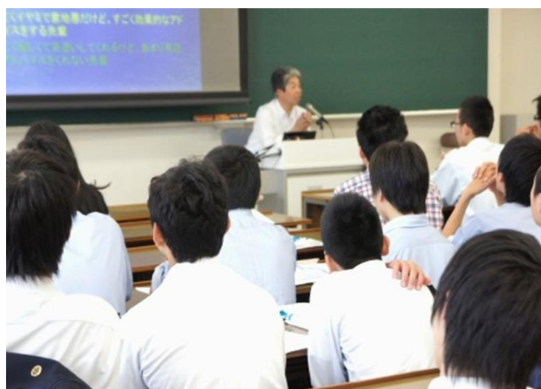
龍谷大学の臨床心理学科の講座「臨床心理面接(カウンセリング)のツボ-もしもあなたが援助者なら...」の講座です。