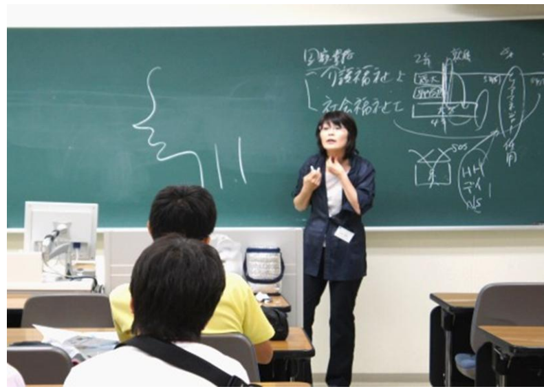
華頂短期大学の介護学科の講座です。2014年より新しく開設される予定の学科です。