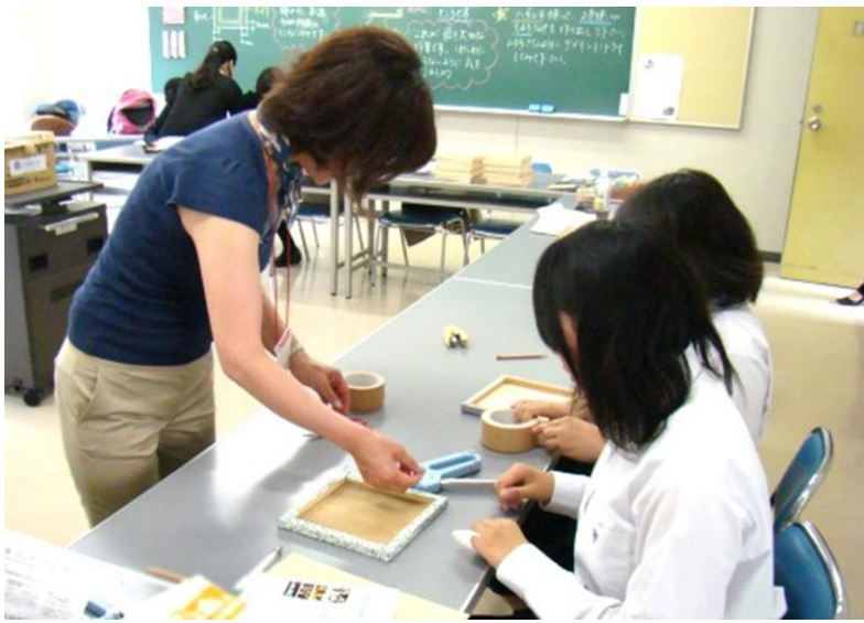
京都橘大学の都市環境デザイン学科の講座。オリジナル装飾パネルをつくることを通して、心地よい空間づくりを学ぶという講座でした。