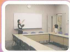
5Fの共同研究室をのぞいてみました！

6F 6Fは京都大学、龍谷大学、京都教育大学、京都外国語大学・短期大学、京都産業大学、立命館大学、京都学園大学の大学院等共同サテライトがあります。ここは、大学院授業をはじめ、社会人講座、大学説明会などで使われています。少人数教室で先生と学生の距離が近いのが特徴です。各教室にテレビが設置され、映像や写真を使った授業が受けられます。