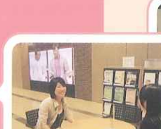
情報交流プラザをのぞいてみました。

2F 3つの会議室のうち圧巻なのは第1会議室。63席ある広さ、テレビ会議システムの設備というこの部屋。私たち、部屋を覗いただけで緊張しました。京都らしい和室の設備もあり、茶道・華道が行われています。坪庭から入る光でとても明るく開放的な空間となっています。