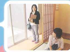
和室をのぞいてみました！

3F 放送大学・京都学習センターがありました。スカイパーフェクトTVでの講義が魅力となっています。