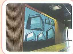
12画面マルチビジョンシステムです！

1F 玄関を入ると、落ち着いた照明の広い静かな空間。そこは「情報交流プラザ」。学生はもちろん市民の方も自由に利用できる情報コーナーです。インターネット、大学案内、掲示などあらゆる情報が得られます。話している声も響かず、安心して友達と勉強できそうですね。正面にドーンと構えるのは、12画面マルチビジョンシステム。大きな画面は情報交流プラザの広い空間のどこからでも見えます。1階には、京都学生祭典事務局がありました。そこでは実行委員の学生が活発に活動していました。また財団法人大学コンソーシアム京都の事務局もありました。