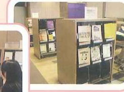
大学情報が満載です！