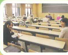
講義がはじまる前の様子です！

4F 講義室でちょうど授業がはじまるころにおじゃましました。イスは固すぎず、スペースも十分にゆったり勉強できそうです。ほかにも2つの講義室があり、取材した日も京都産業大学の授業が行われていました。