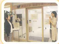
3Fには、放送大学 京都学習センターがあります！

3F 放送大学・京都学習センターがありました。スカイパーフェクトTVでの講義が魅力となっています。