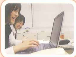
記事を作る私たちです！

6F 6Fは京都大学、龍谷大学、京都教育大学、京都外国語大学・短期大学、京都産業大学、立命館大学、京都学園大学の大学院等共同サテライトがあります。ここは、大学院授業をはじめ、社会人講座、大学説明会などで使われています。少人数教室で先生と学生の距離が近いのが特徴です。各教室にテレビが設置され、映像や写真を使った授業が受けられます。