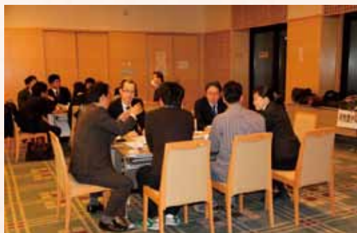
〈会場の様子〉 研究テーマごとに テーブルで分かれ て自由闊達に議論 しました。