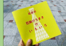
リーフレット作成 「厄除けちまきのいろいろ」