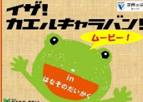
「イザ!カエルキャラバン! In はなそのだいがくムービー」