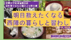
京町家でまなび庵