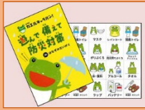
リーフレット作成 「遊んで備えて防災対策」