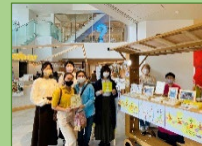
フィールドワーク