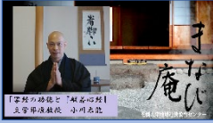
オンライン写経会