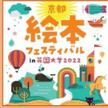
京都絵本フェスティバル in 花園大学2022