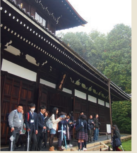
が宋より持ち帰った貴重な書蹟類、鎌倉期以来の 文書などが多数所蔵されています。また境内の建造 物も室町期以来のものが多数現存するなど、文化

京都の現役大学生の皆さんが 修学旅行や校外学習で "京都の魅力"を 教えてくれます!